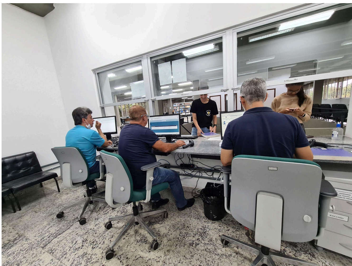
Equipe de atendimento Biblioteca Central