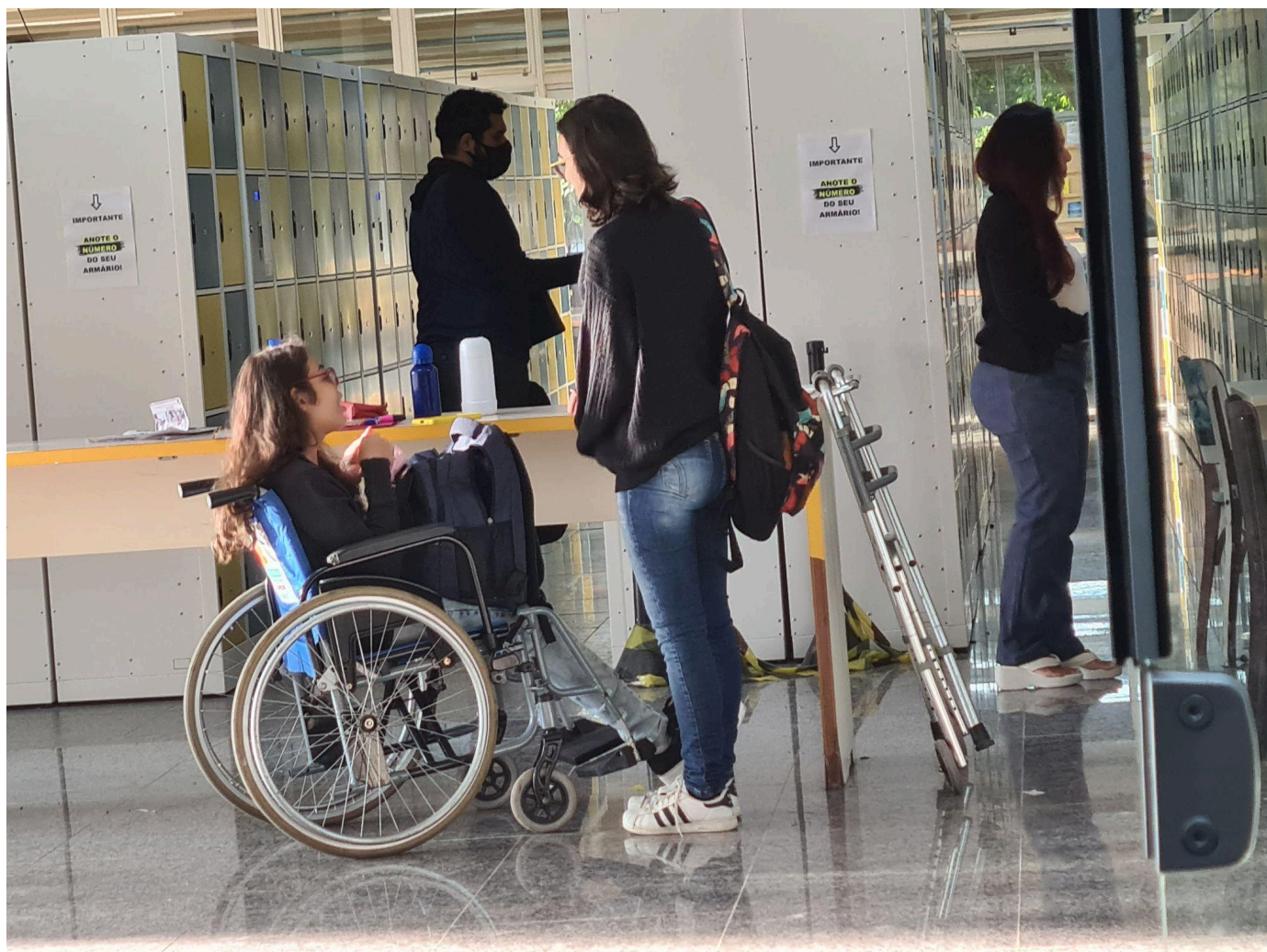
Estudante com Deficiência utilizando os espaços