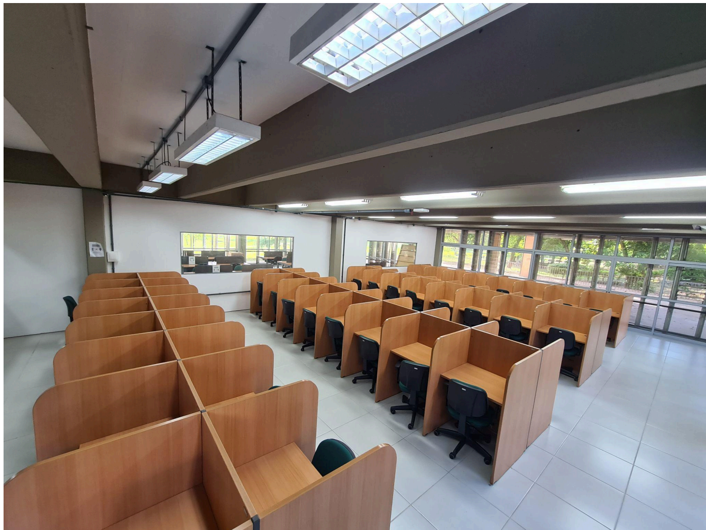
Sala de estudo individual