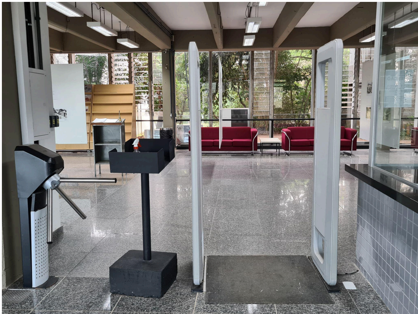
Acessibilidade na entrada da Biblioteca Central